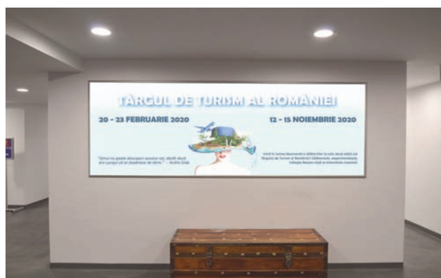
CASETA CU RAMA CLICK, DIMENSIUNE 320X110 CM