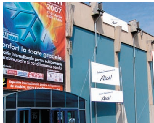
AFISARE BANNERE PE FATADA PAVILIONULUI C1