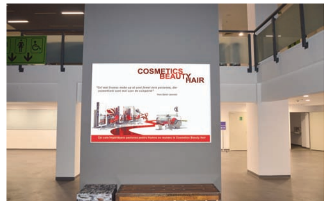
CASETA CU RAMA CLICK, DIMENSIUNE 200X140 CM